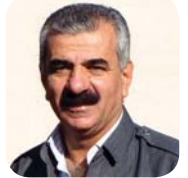
عمر بالکی برگردان: آزاد کریمی