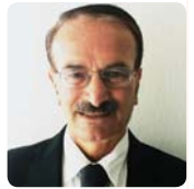
مصطفی شلماشی برگردان: سروش

پس از بیش از هشت روز مذاکره‌ی طاقت‌فرسا و طولانی میان هیأت ایرانی و وزرای امور خارجه‌ی شش قدرت جهانی در آخرین دور نشستهای فی‌مابین در لوزان، سوئیس، طرفین با انتشار بیانیه‌ی مشترکی، چارچوب توافق نهایی را اعلام کردند. چکیده‌ی این تفاهم‌نامه که در بیانیه‌ی از سوی خانم فدریکا موگرینی، مسئول سیاست خارجی اتحادیه‌ی اروپا و آقای ظریف، وزیر امور خارجه جمهوری اسلامی به دو زبان انگلیسی و فارسی قرائت گردید، این بود که ایران غنی‌سازی اورانیوم خود را تا میزان چشمگیری کاهش خواهد داد، تنها مرکزی که برای غنی‌سازی اورانیوم باقی خواهد ماند، نطنز خواهد بود. مرکز فردو به یک مرکز فیزیکی و تحقیقاتی و علمی تغییر خواهد یافت. جمهوری اسلامی اورانیوم غنی شده با غلظت بالای خود را به خارج از کشور منتقل خواهد کرد. ایران مرکز اتمی اراک و راکتور آب سنگین خود را به شیوه‌ای تغییر خواهد داد که نتواند در حد ساخت و تولید سلاح هسته‌ای، پلوتونیوم تولید کند. جمهوری اسلامی ملزم به قبول و رعایت پروتکل‌های الحاقی و همکاری کامل به آژانس بین‌المللی انرژی خواهد شد و برای مدت ۱۰ سال تحت نظارت کامل خواهد بود و برای مدت ۱۵ سال نیز حق تأسیس راکتور جدید را نخواهد داشت.