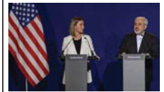
توافق میان غرب و ایران