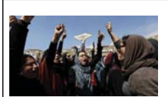
واقعیت انسان‌گرایی و مفهوم تقدس

همزمان با مذاکرات هسته‌ای در شهر لوزان سویس، دهها سازمان حقوق بشری و فعالان ملیت های ایرانی نشست‌های جانبی متعددی را در مقر شورای حقوق بشر سازمان ملل در شهر ژنو در رابطه با حقوق ملیت‌های ایران برگزار کردند. در این نشست احمد شهید گزارشگر ویژه سازمان ملل در مورد وضعیت حقوق بشر در ایران و خانم شیرین عبادی برنده جایزه صلح نوبل و تعدادی از کارشناسان مستقل سازمان ملل و همچنین نمایندگان سازمان‌های حقوق بشری ملیت‌های ایرانی نظیر کرد، عرب‌های اهوازی، ترک‌های آذربایجانی، بلوچ‌ها، کردها، ترکمن‌ها و دینی همچنین نمایندگان سازمان‌های اقلیت‌های دینی و مذهبی همچون اهل سنت، مسیحیان و بهائیان مشارکت گسترده‌ای داشتند. احمد شهید، گزارشگر ویژه سازمان ملل در مورد وضعیت حقوق بشر در ایران تأکید کرد که او برای متوقف کردن احکام اعدام فعالان ملیت‌ها گام‌های مثبتی را از طریق مذاکرات با مقامات ایرانی برداشته است، اما ایران برای چهارمین