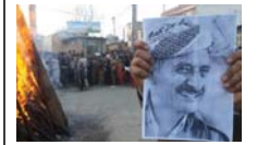
سال تازه، سیاستی تازه‌تر